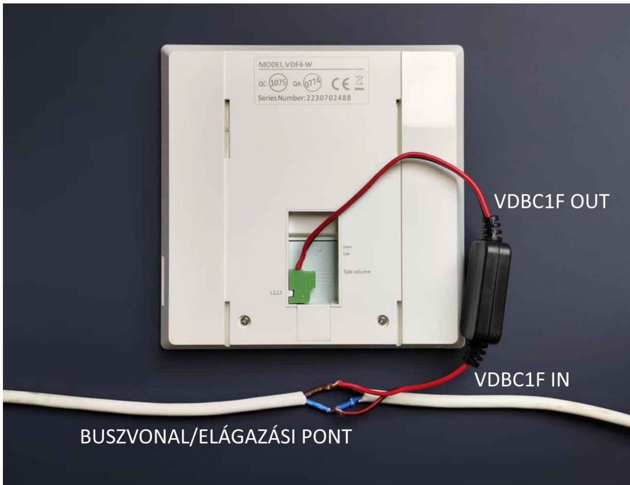
1. Ábra: A VDBC1F bekötése